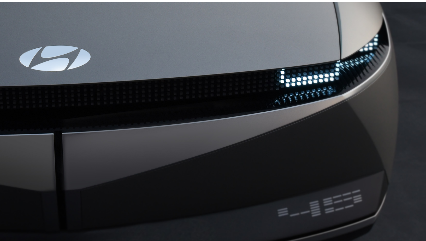
Hyundais konseptbil 45.